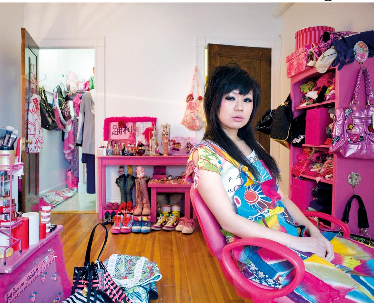
Ai > Elle a 22 ans, et vit à Boston aux États-Unis. "Je n'ai pas de modèle. Je pense qu'il ne tient qu'à toi de faire du lendemain une belle journée."